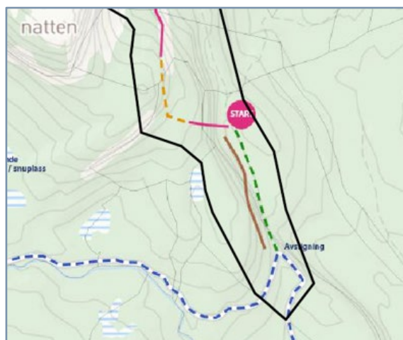
Figur 2: Skisse viser aktuelt område for alternativ/lågterskelstei m/wire langs skogsveg, merka med bunlinje (iVest Consult AS)

Ein vil også i nedre del av området, langs etablert skogsveg, sjå på moglegheiter for å kunne legge til rette for ein horisontal plankastei m/wire langs fjellveggen, for å lage eit alternativ/lågterskeltilbod for dei som ikkje ønsker eller har moglegheit å klatre Via Ferrata, t.d. mindre born eller eldre. Denne er tenkt etablert på ein slik måte at den innbyr til lettare framkome, men med sikkerheitssele, slik at ein likevel kan få ein spektakulær oppleving. Sjå oversiktskart for lokalisering av denne i fig.2.