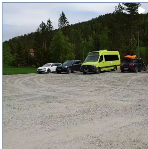
Figur 3: Blider viser eksisterande baseområde for Sigdal Aktiv med opparbeidd parkeringsplass på Gråskei

( https://www.instagram.com/sigdal_aktiv/ )